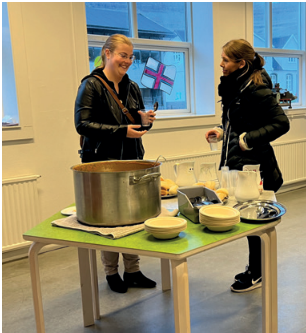
Námsfrøðingaráðið borðreiddi við suppu, áðrenn tiltakið byrjaði