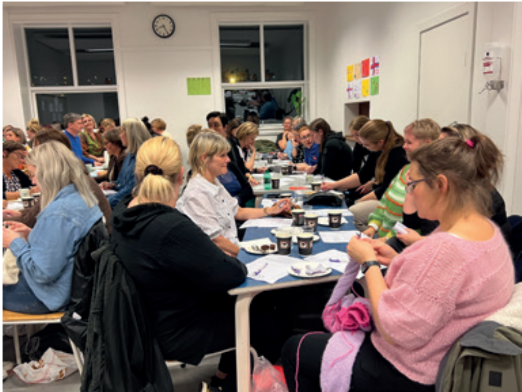
Stórir áhugi var fyri evniskvøldinum um relasjónir, ið Námsfrøðingaráðið skipaði fyri í Klaksvík

ini – relasjónirnar – ímillum menniskju sum eina tætt spunna eiturkoppant.