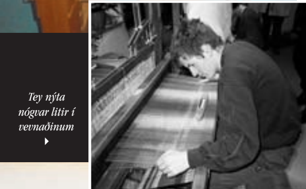
Tey nýta nógvar litir í vevnaðinum