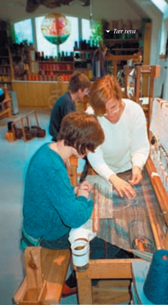
▼ Tær veva