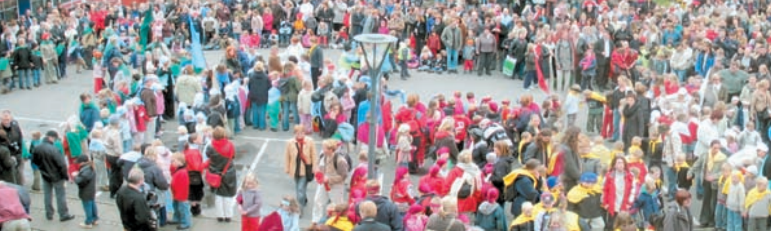
Tiltakið endaði við, at börnini savnaðust á Váglinum, har tey sungu og trinu føroyskan dans.