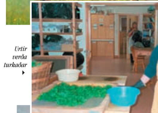
Urtir verða turkaðar