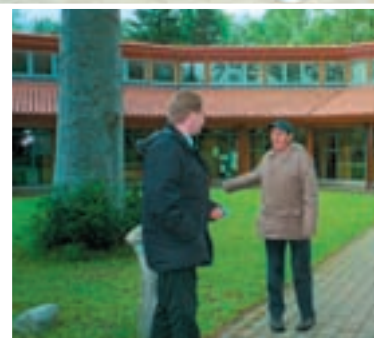
▲ Newton Dee Village