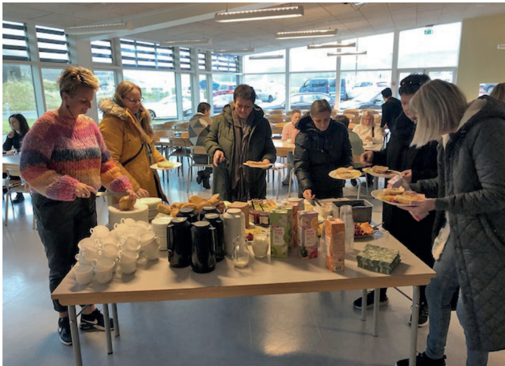
Tilmeldingin til evnisdagin um sálarligt arbeiðsumhvørvi var góð, og dagurin var eisini eitt gylt høvi til prátt og hugnaliga samveru