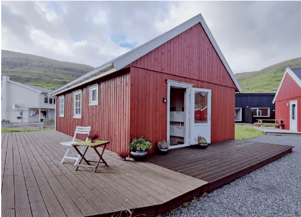
Frítiðarsmáttan er 40 fermetrar stór og hefur rúm fyri seks gistandi gestum