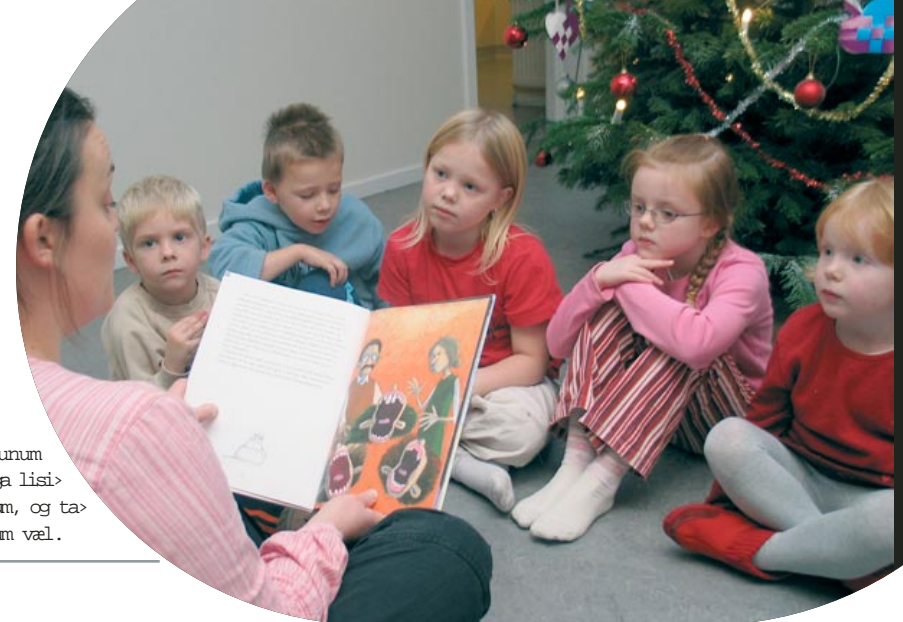
Á dagstovnunum verður døgliga lisið fyri børnum, og tað dámar teimum væl.