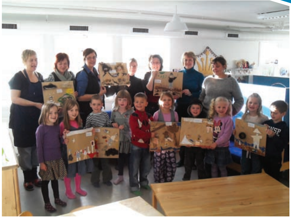
Pedagogarnir úr Grønlandi, Íslandi og Føroyum saman við børnunum. Tey hava arbeitt við føroyskum dansi og gjørt myndir til hvørt einstakt ørindi av Øskudølgi og Sópingarkonu. Myndirnar hanga nú á veggnum í Býlingshúsinum á Norðasta Horni

Vit vaksnu høvdu eisini eina góða og kveikjandi viku og gleða okkum til annan part av framhaldssøguni, sum longu hefur verið, tá ið hetta kemur í blaðið.