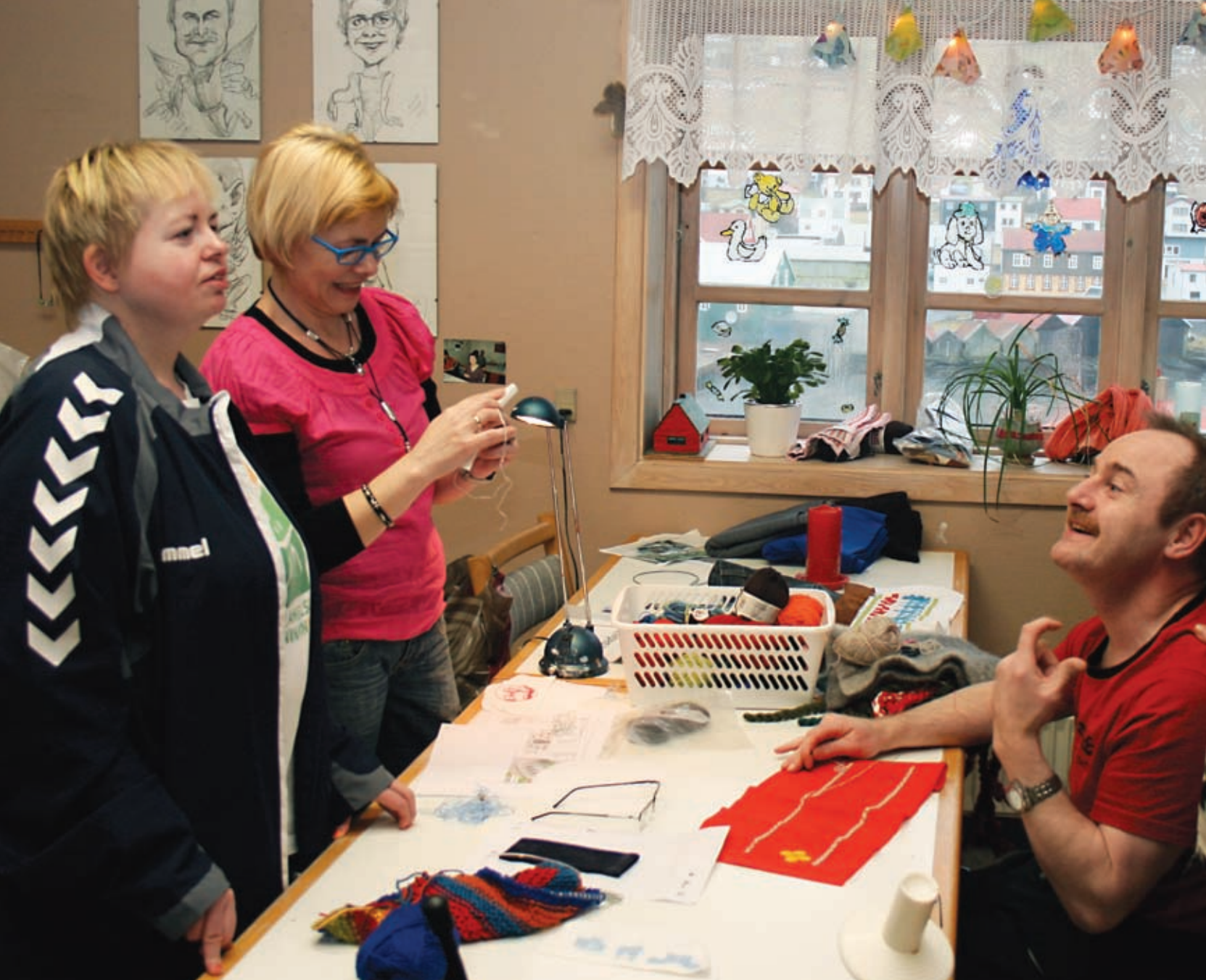
Verkstaðurin á Bakka í Vági

Teacch miðar eftir, at búfólkini gerast sjálvstøðug. Skipaður pedagogikkur í Teacch-ætlanum tekur støði í innihaldsríkum og týðandi vanum og sjónvendum stuðli, soleiðis at persónurin so við og við lærir at klára seg við minni stuðli frá starvsfólki.