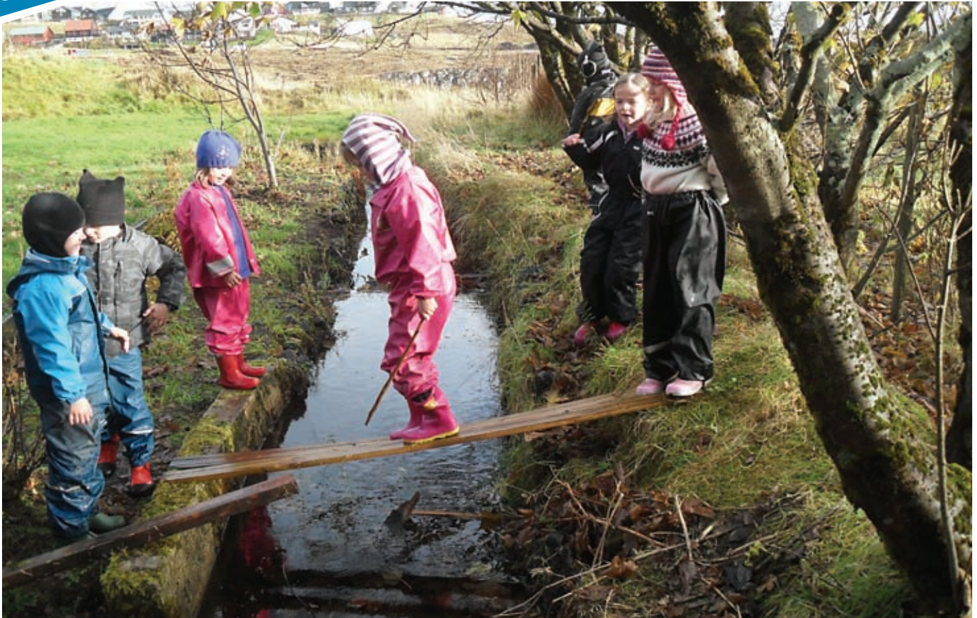
Fyriréikandi kanningar til at gera brúgv um veitina

á stovnunum hjá hvørjum øðrum, so teir á staðnum kunnu kanna, hvussu arbeið verður har, seta ljós á hetta arbeiðið og hjálpa hvørjum øðrum at menna tað arbeiðið, sum gjørt verður á teimum ymisku stovnunum og tað ástøðiliga grundarlag, sum arbeiðið byggir á.