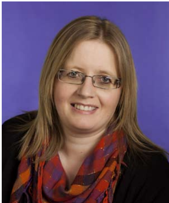
Elin N. W. Tausennevndarlimur

Føroya Pedagogfelag hevur ein grunn, nevndan „Aktións- og upplýsingargrunnurin. „Sambært reglugerðini fyri grunnin er endamálið við grunninum“ at stuðla limum felagsins undir aktión/verkfalli. Harumframt at granska, styrkja og breiða kunnleika og fatan fyri tí pedagogiska arbeiðinum.“