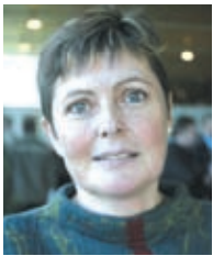
Sólja í Ólavstovu løgtingsins umboðsmaður

Løgtingsins Umboðsmaður hevði gjørt vart við, at Fólkatingsins Umboðsmaður og dómstólarnir hava sligið fast, at alment sett starvsfólk hava rætt til at finnast at. Eisini alment, um teirra arbeiðsumstøður ella tað virksemi, tey fáast við, verður hildið at vera óforsvarligt.