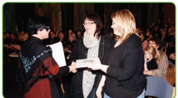
Nevndarlimirnir heilsa nýggju námsfrøðingunum