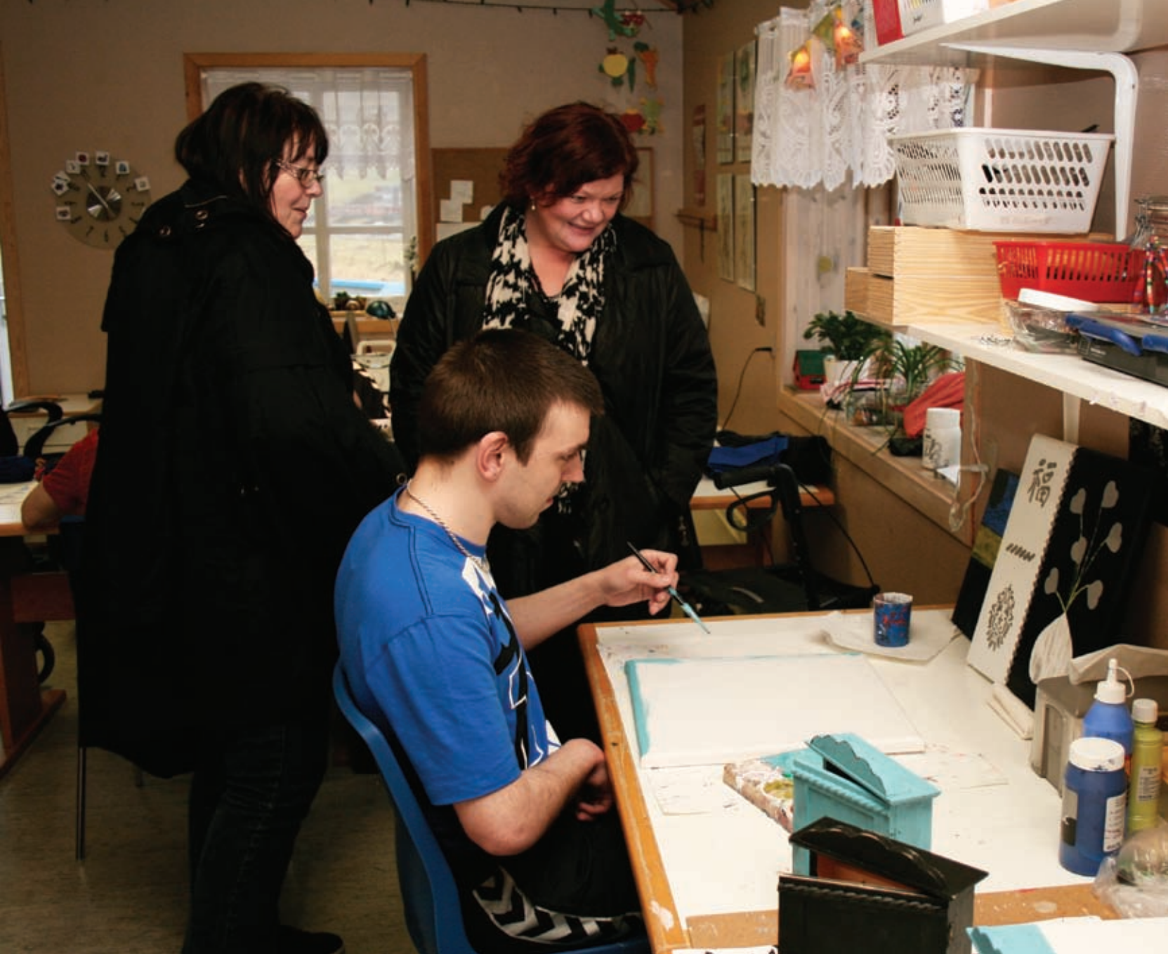
Verkstaðurin á Bakka í Vági

matgerð, reingerð, keypa, vaska klæðir, rudda o.s.fr.