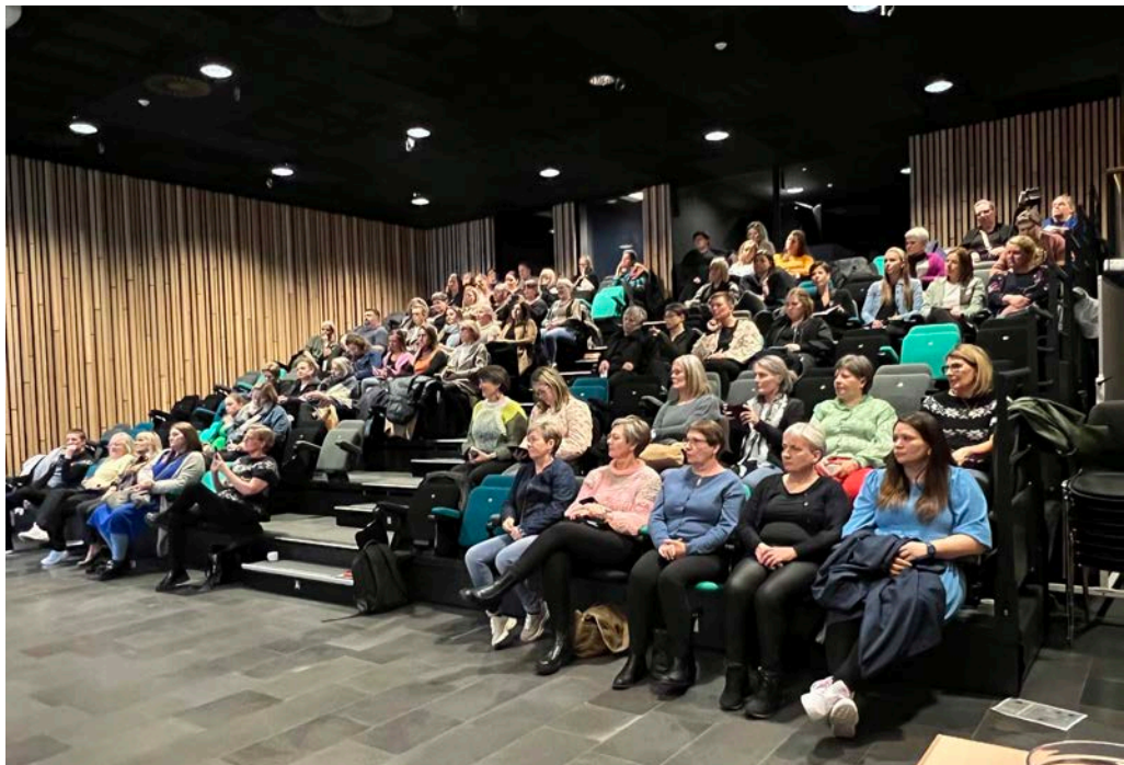
Eykaaðalfundurinn hjá Leiðararáðnum varð hildin í Smæruni í Havn 3. mai