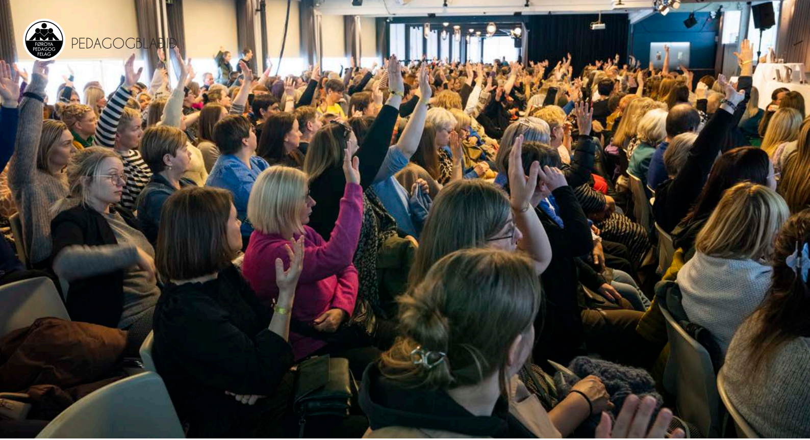
Ongi persónsval vóru á skrá, og atkvøtt varð við hondsupprættan um tær báðar lógarbroytingarnar – ongin atkvøddi ímóti