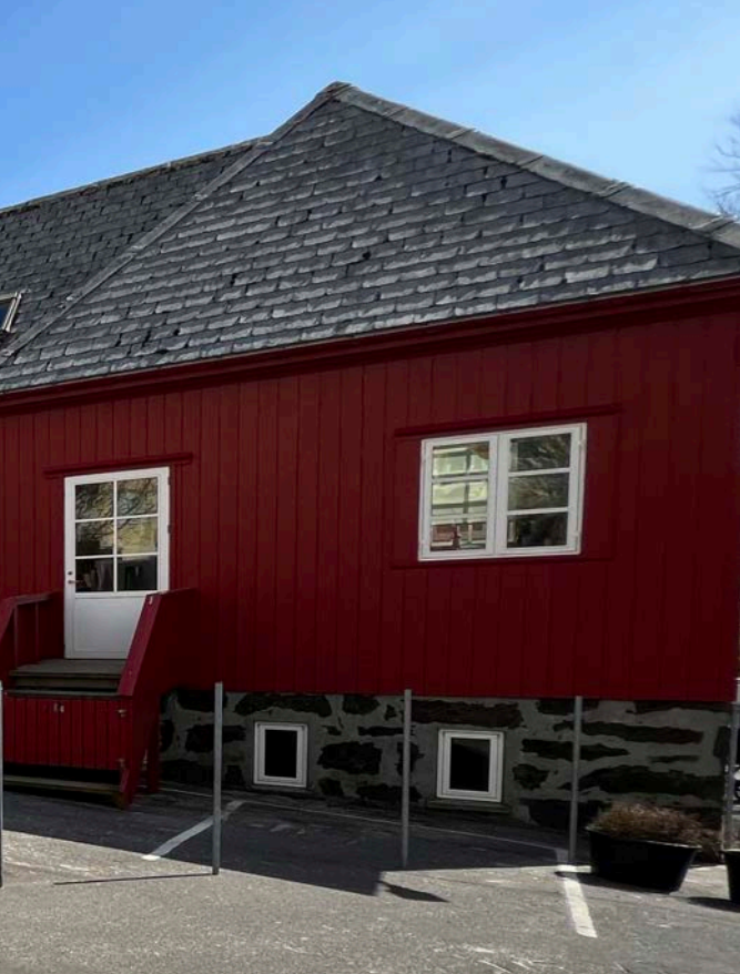
Gamli Realskúlin var fyrsti bygningurinn, sum Miðstovnurin flutti inn í á nýggju staðsetingini, og her húsast vøggustovan enn