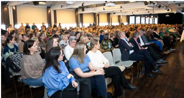
Umleið 550 limir tóku lut í aðalfundinum hjá Føroya Pedagogfelag á ár, tað er meira enn fjórði hvør limur og tað mesta nakrantíð