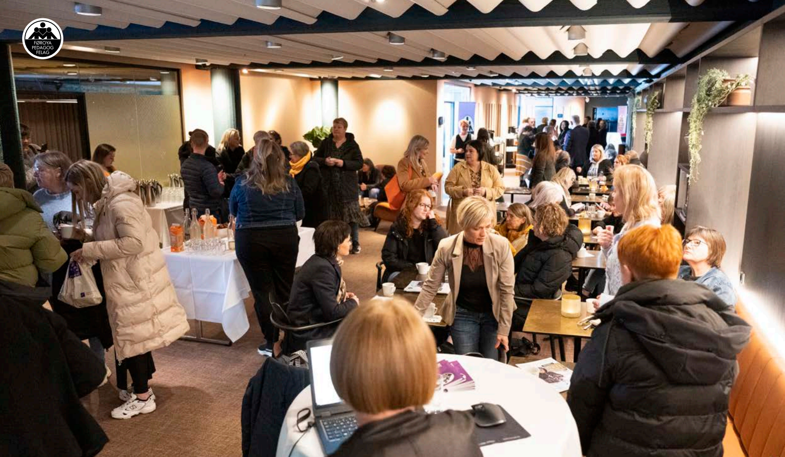
Prátið gekk dúgliga í steðginum ímillum aðalfundirnar hjá ráðunum og stóra aðalfundin hjá felagnum