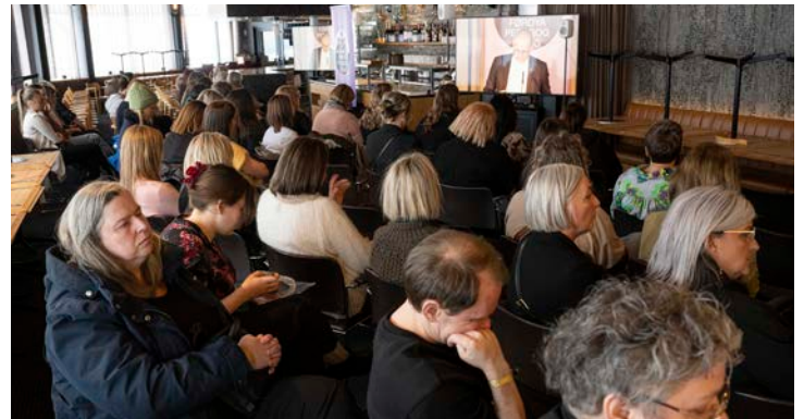
Stórskíggjarnir komu til sín rætt, tí øll høvdu ikki útsýni til røðarapallin