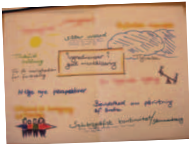
Ein tekning um mentalisering, sum er ein av arbeidsháttunum, tey nýta har.