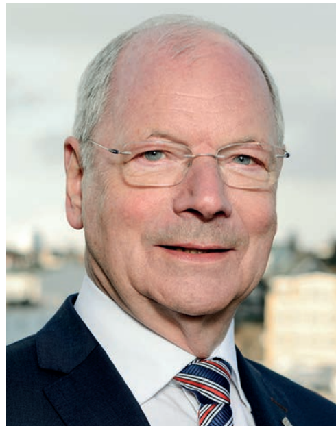
Borgarstjórin legði dent á, at tað ikki eru pengar, sum vanta í á dagstovnaøkinum, men starvsfólkaorka.