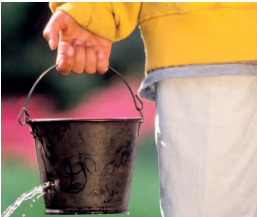
Barnafátækradømið finst í øllum londum, eisini Føroyum og hinum Norðurlondum