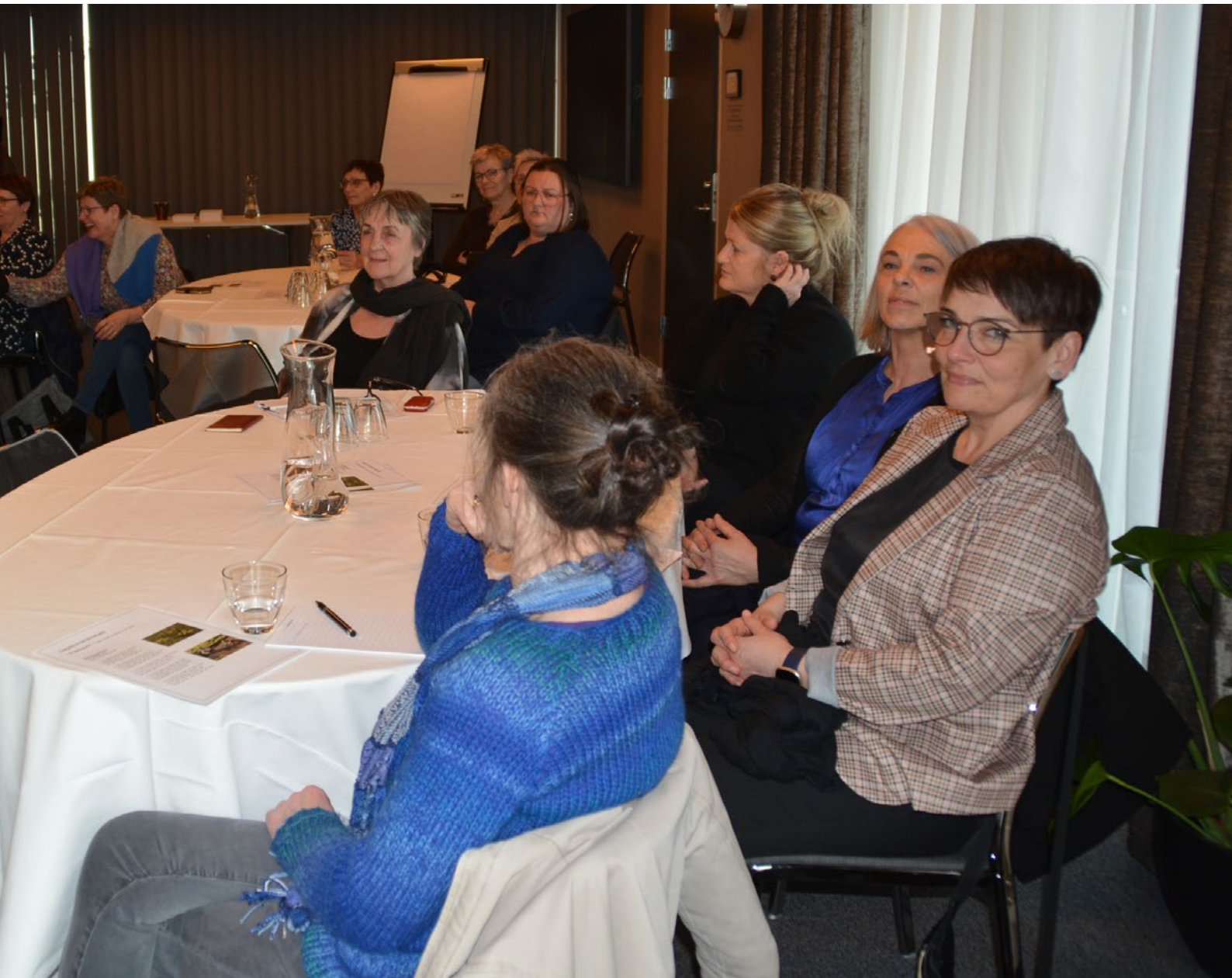
Nógv varð flent, tá pionerarnir mintust aftur á farnar dagar