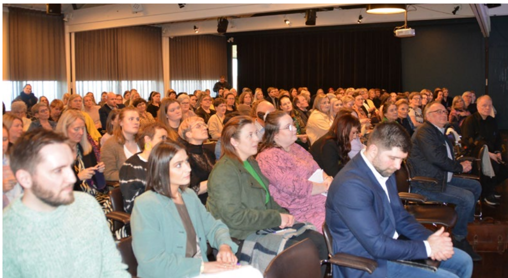
Loksins bar til aftur at halda ein vanligan aðalfund í Føroya Pedagogfelag, og tað sást aftur á upp- møtingini